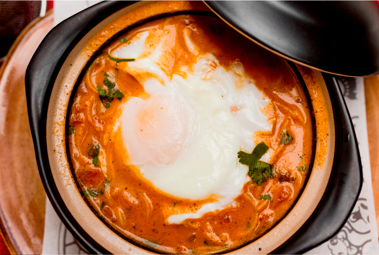
SOPITA CRIOLLA DE ANTAÑO